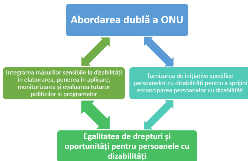
Fig. 2. Abordarea bilaterală a ONU [elaborată pe baza DFID 2000 [4].

În 2017, UN Women a înființat o echipă de lucru globală internă privind incluziunea persoanelor cu dizabilități și intersecționalitatea (GTTDII) pentru a consolida activitatea ONU în acest domeniu. În 2020, UN Women a înființat o comunitate de practică privind integrarea dizabilității și intersecționalitatea (DII-CoP) la nivel de entitate pentru a sprijini activitatea critică de integrare a incluziunii dizabilității.